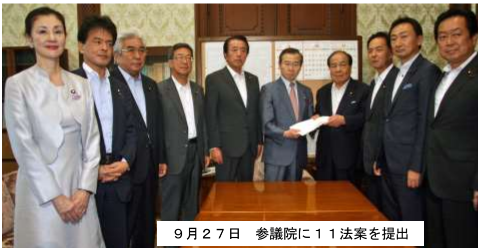
9月27日 参議院に11法案を提出

身を切る改革を実現するため、衆議院議員の定数削減、国家公務員の総人件費2割カット、企業や団体からの政治献金を全面的に禁止するなど、11本の法案を第一弾として参議院に提出しました。