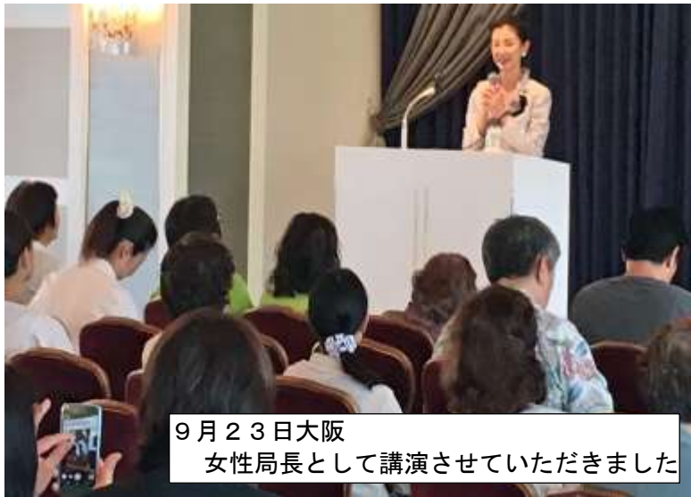
9月23日大阪 女性局長として講演させていただきました