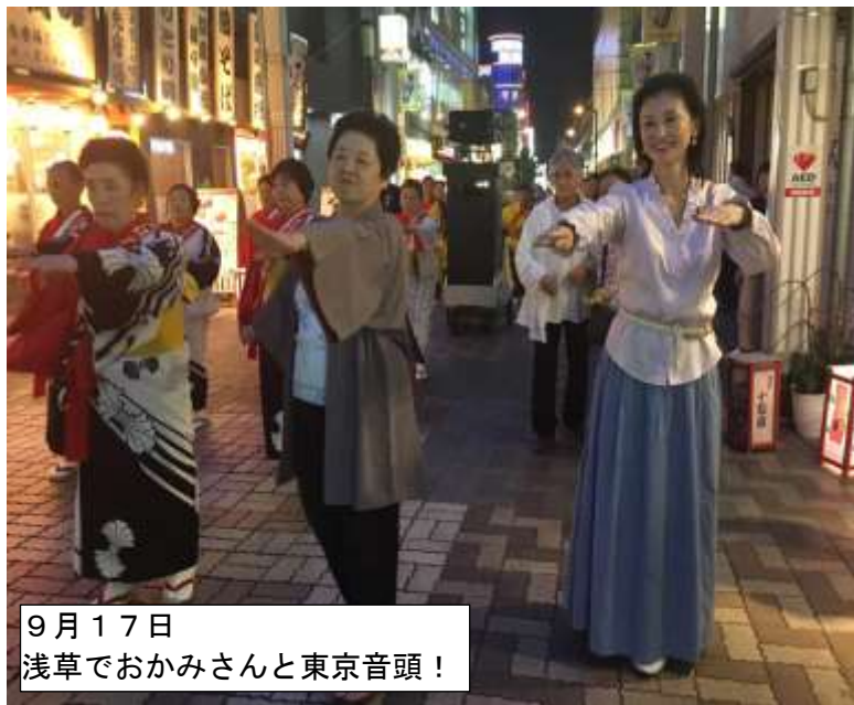
9月17日 浅草でおかみさんと東京音頭！