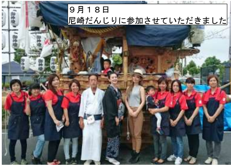
9月18日 新潟だんじりに参加させていただきました