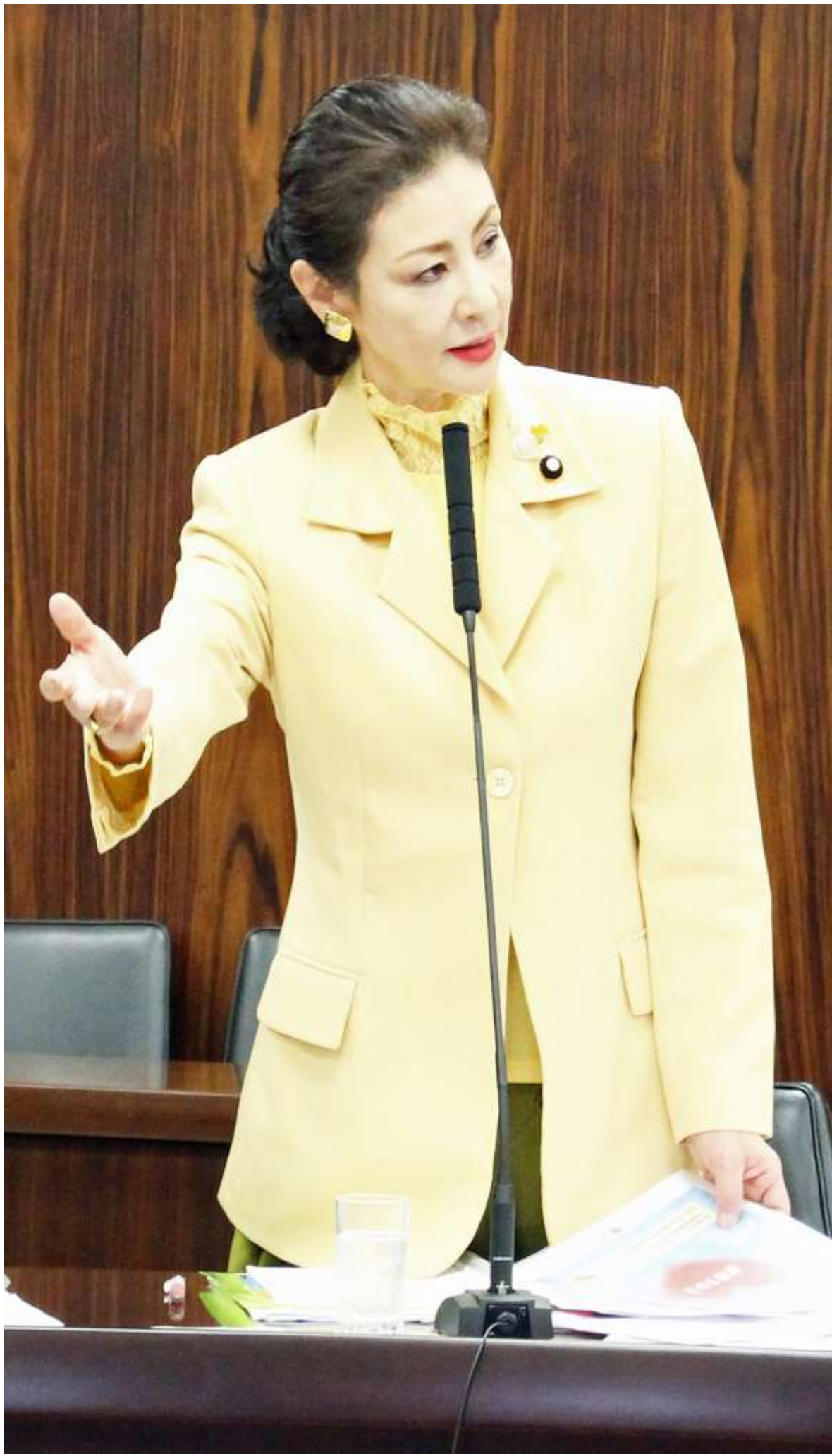
法務委員会で大相撲の「女性土俵問題」に関して意見表明

ど」と。録音を取るしかなかったデータをもとに上司に訴えても「性格まで変えることはできない、次官なんだから、うまくやってよ、せっかく気に入られたんだから」となったのかもしれない。男のセクハラ問題は女に任せて男子はなるべく遠ざかっていたかった。男が男の問題を意識的に解決しようとは思わない。「男って生き物はね〜」なんて言いながら見ないふりをしてきたというわけです。