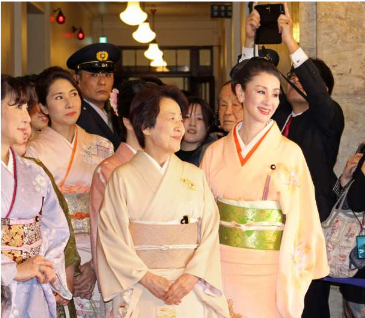
写真) 上・国会召集日(衆議院正玄閣) 下・共同通信社のHPから転載