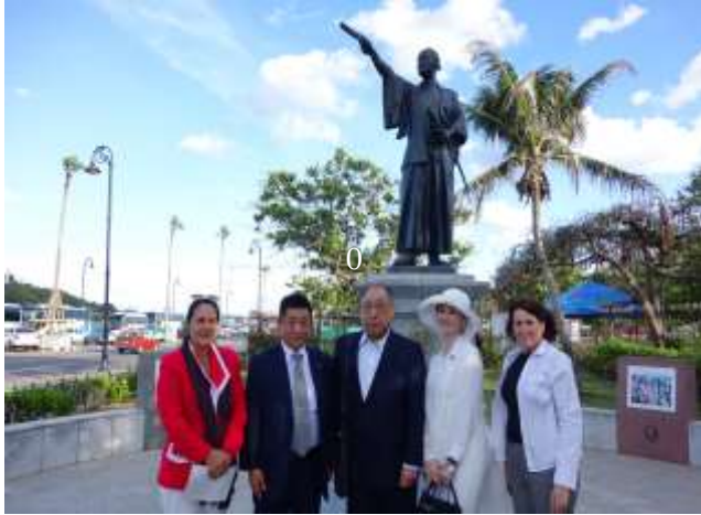
ハバナに立つ「至誠の人」支倉常長のブロンズ像