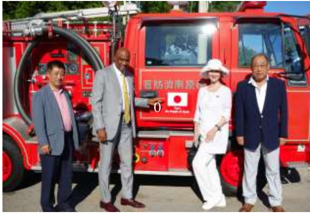
岐阜・各務原市の消防車がキューバで第二の人生