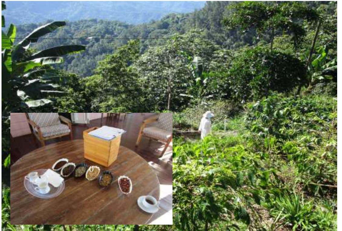
ジャマイカで生産される希少なブルーマウンテン豆をUCCが日本に安定供給している