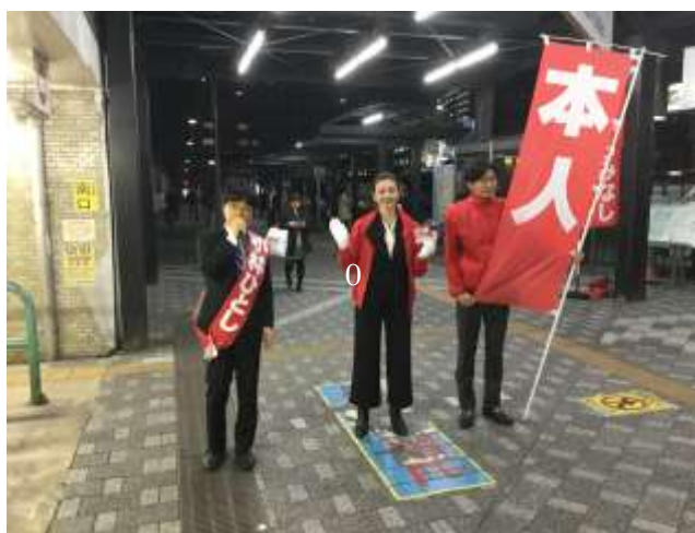
石井議員が自ら執筆したネット記事です