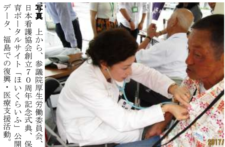
写真 上から、参議院厚生労働委員会、 日本看護協会創立70周年記念式典、保 育ポータルサイト「ほいくらいふ」公開 データ、福島での復興・医療支援活動。