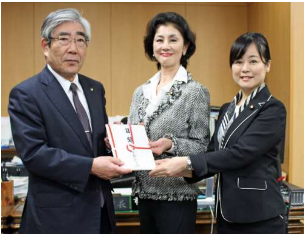
写真) 上・石巻市大橋の仮設住宅 下・石巻市役所で亀山紘市長に寄付